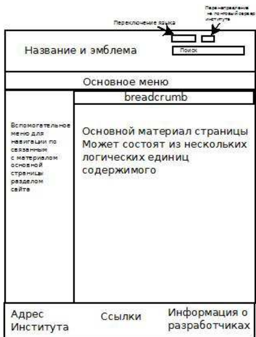
Базовый макет страниц сайта: