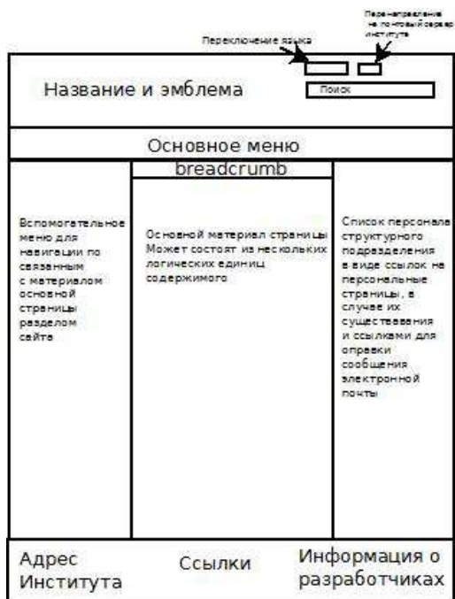
Макет страниц сайта относящихся к структурным подразделениям: